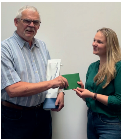
Frau Stadlbauer überreichte dem glücklichen Gewinner seinen Gutschein