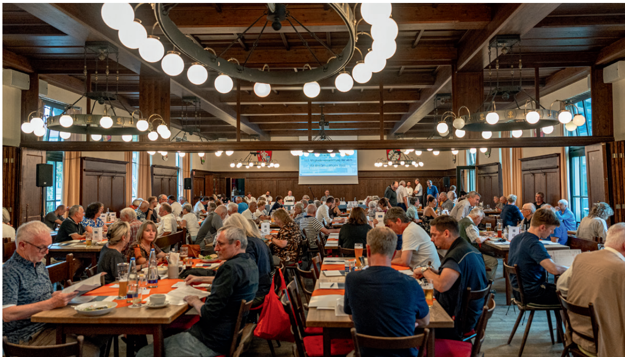
Die Mitglieder der ebm im Bavariasaal des Wirtshauses am Bavariapark

Die 111. Mitgliederversammlung – MV – (für das abgelaufene Geschäftsjahr 2022) fand am 26.06.2023 im Bavariasaal des Wirtshauses am Bavariapark statt.