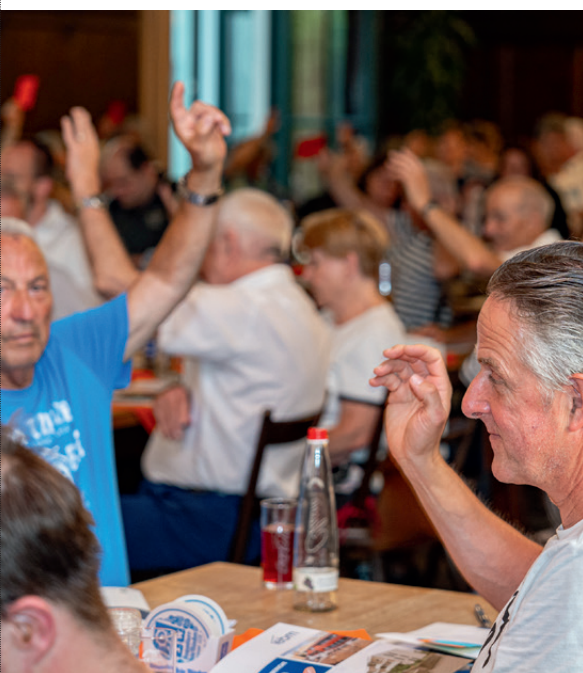
Die Mitglieder bei der Abstimmung

Nach Antrag auf Entlastung durch ein Mitglied haben die anwesenden Mitglieder den Aufsichtsrat einstimmig entlastet. (113 Ja-Stimmen, 0 Nein-Stimmen, 0 Enthaltungen)