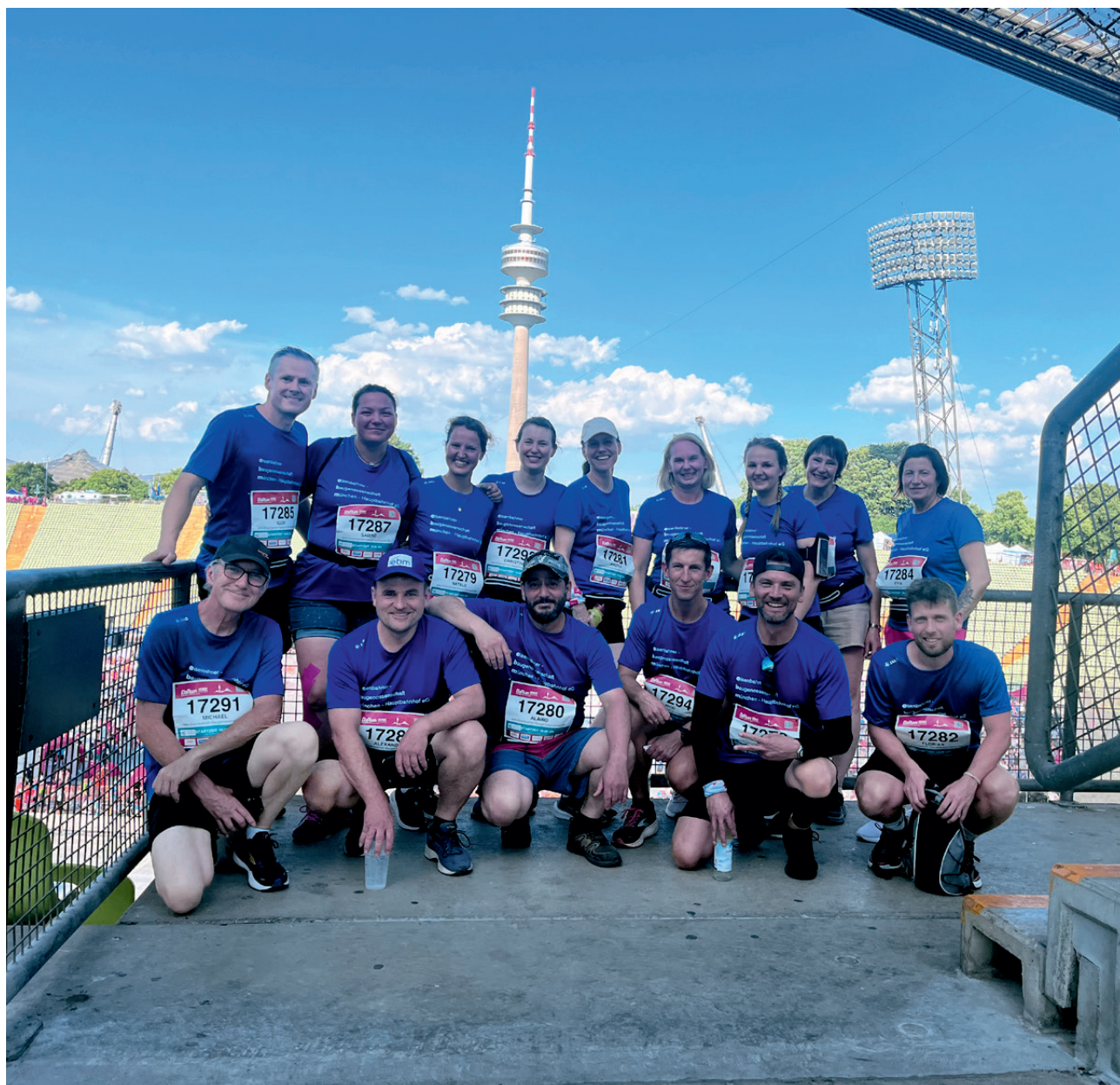
Die Mannschaft der ebm mit Vertretern aus allen Abteilungen

Wir möchten es aber auch nicht versäumen uns bei allen unseren Unterstützern, Kolleginnen und Kollegen für die gesamte Zuarbeit und Anfeuerung zu bedanken.