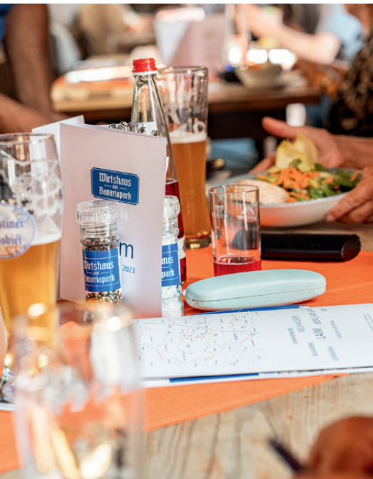
Auch für das leibliche Wohl der Besucher war gesorgt