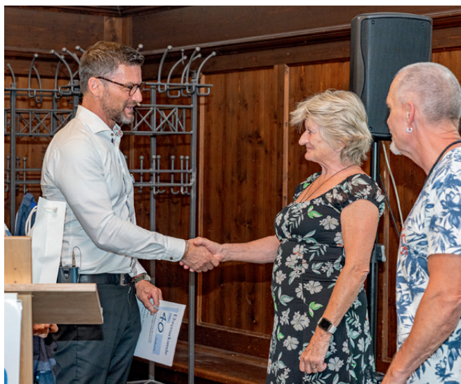
Ehrung von langjährigen Mitgliedern

Entsprechend den Gepflogenheiten in unseren MV wurden auch dieses Mal diejenigen Mitglieder geehrt, die 25, 40 und 50 Jahre unserer Genossenschaft die Treue gehalten haben. Die Jubilare bekamen vom Aufsichtsrat und Vorstand eine Ehrennadel mit Urkunde und ein kleines Präsent als Dank für ihre Zugehörigkeit in unserer Genossenschaft.